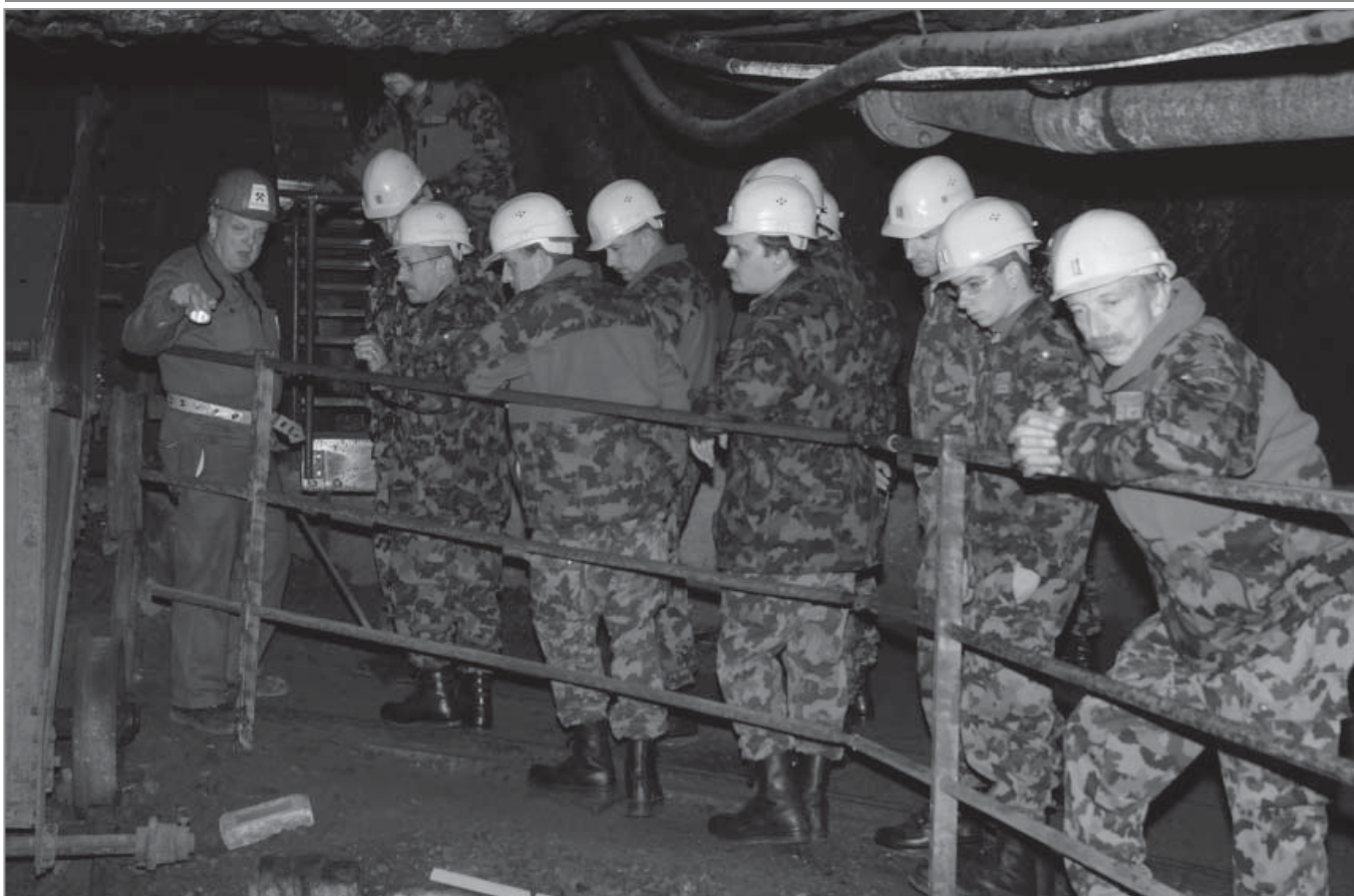
Alle hören gespannt den Ausführungen unseres Führers zu