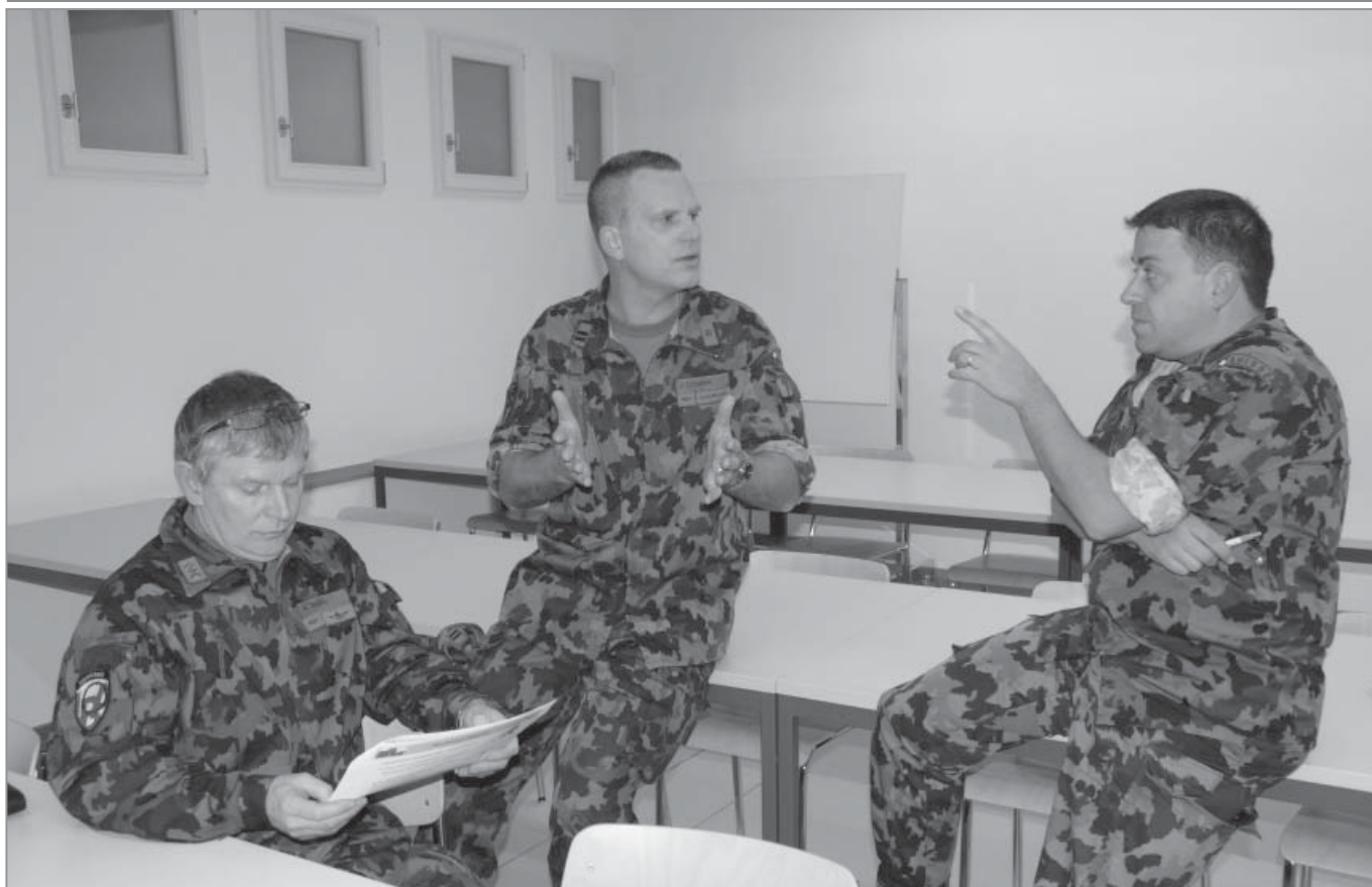
Wenn Hände und Blicke sprechen könnten