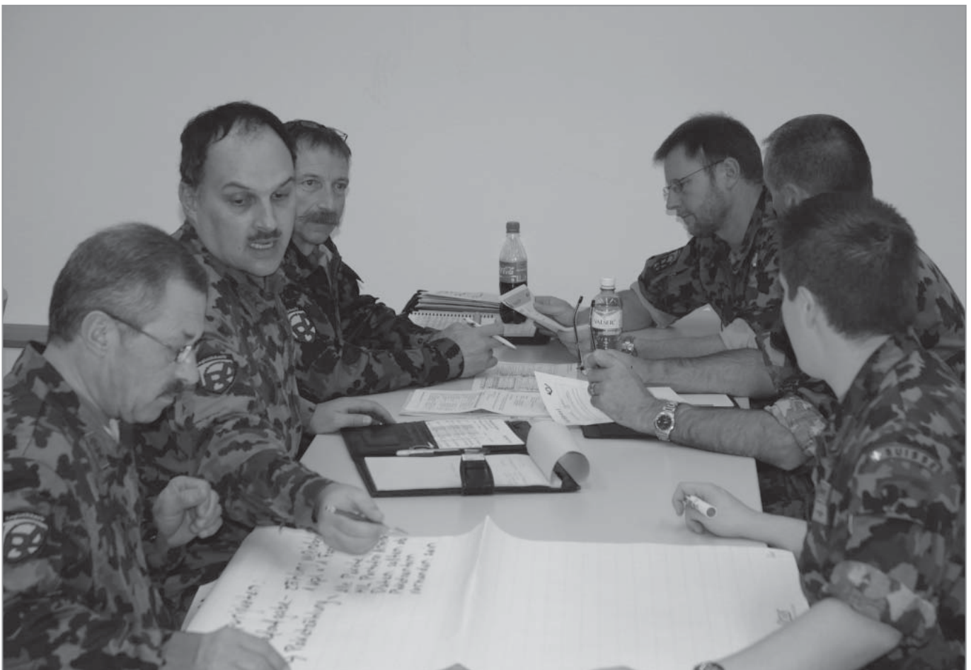
Im Workshop wird angeregt diskutiert und notiert