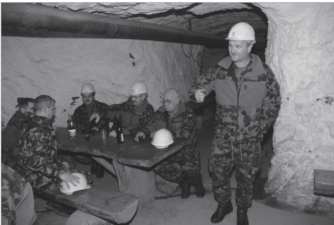
Beim verdienten Erfrischungstrunk tief unter dem Berg