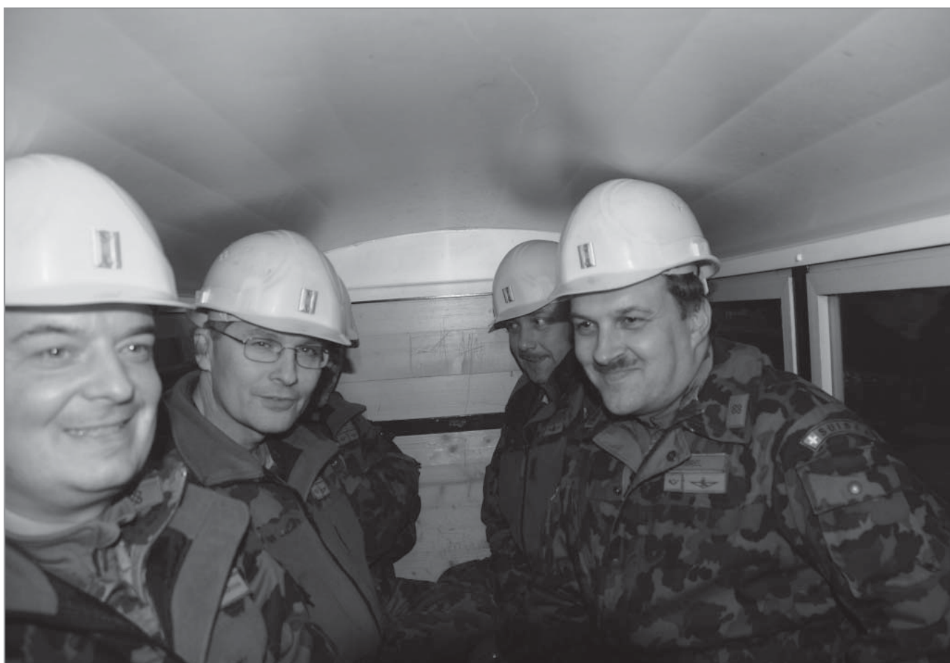
Mit dem Gonzen Express unterwegs in die Tiefe des Berges