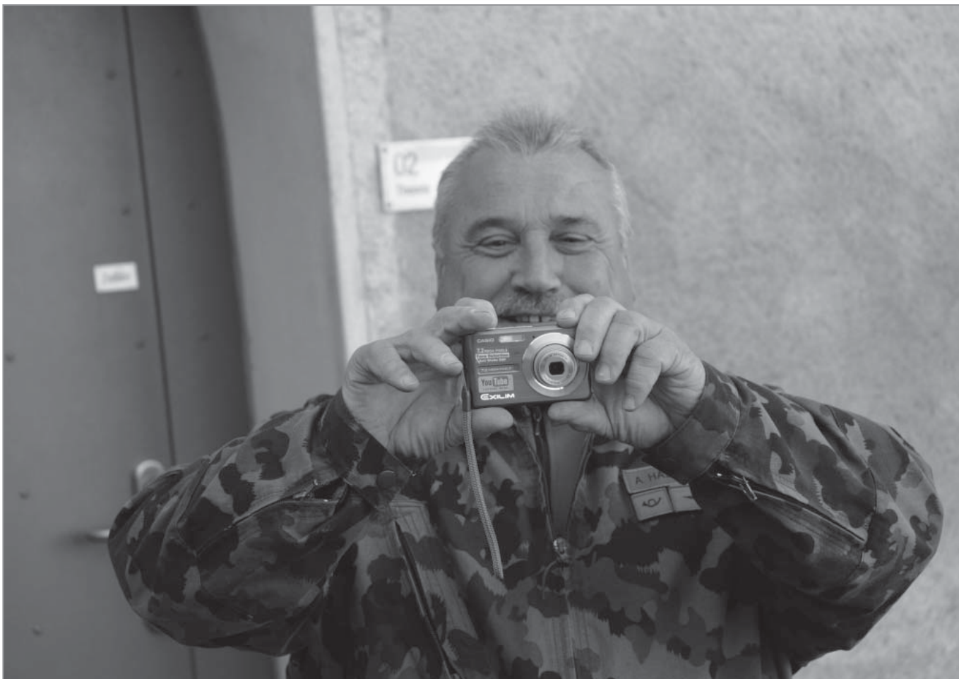
Wer hat dann Adj Uof Hässig Toni im Visier