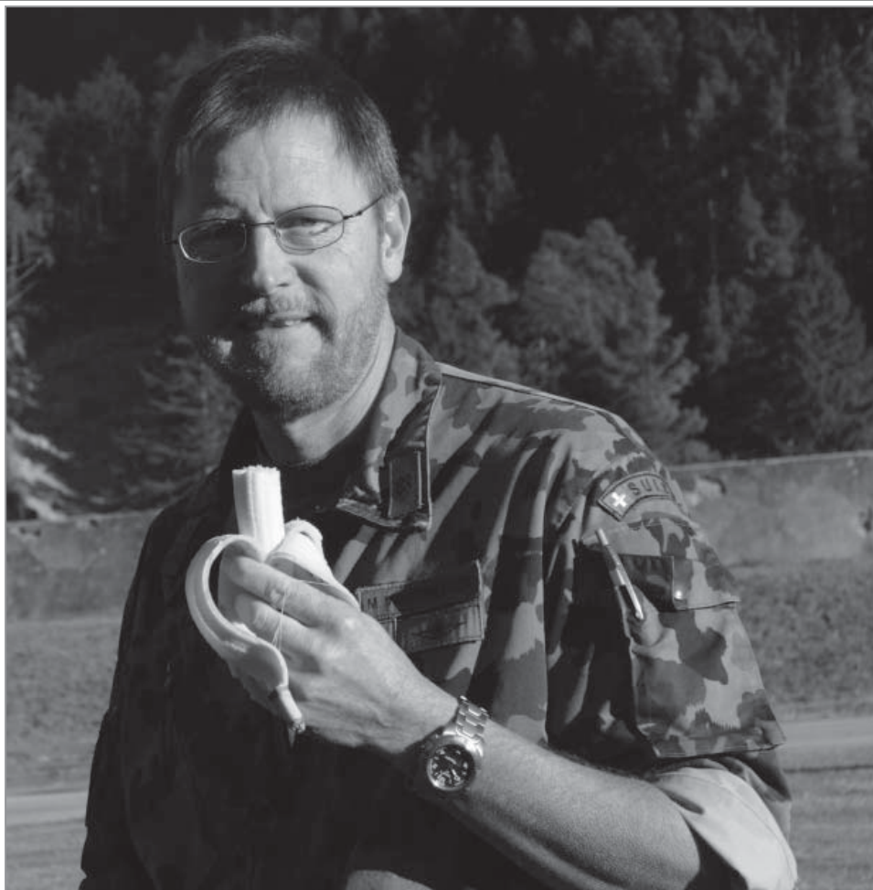
E Guete Adj Uof Weissmüller Markus