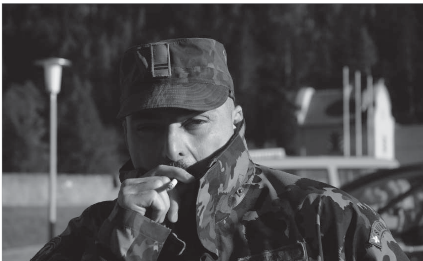
Oblt La Puma ist sich im Tessin andere Temperaturen gewöhnt