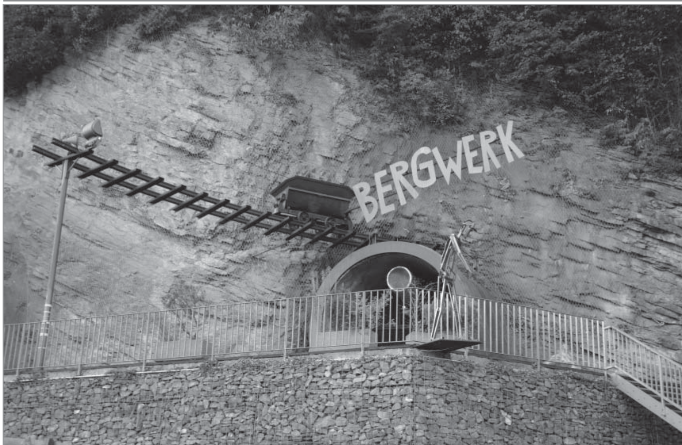
Eingang zum Gonzen Bergwerk